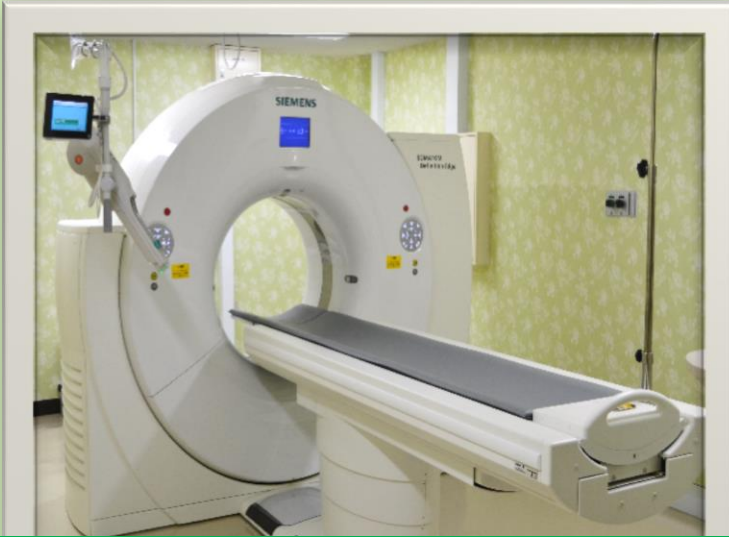
シーメンス社製 SOMATOM Definition Edge マルチスライス(128スライス)CT装置